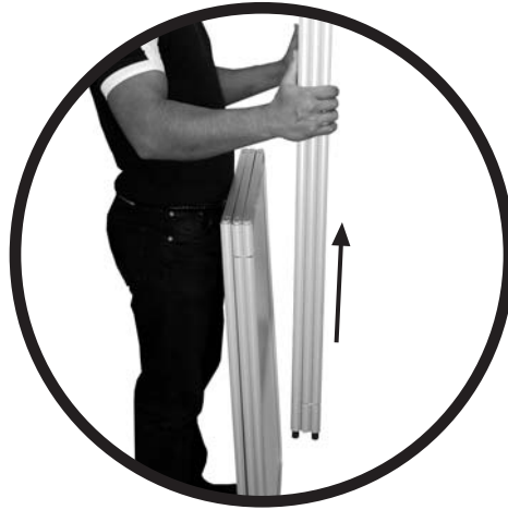
...ziehen Sie das obere Teil nach oben...