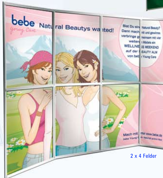
2 x 4 Felder