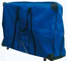
Transportnylontasche mit oder ohne Rollen