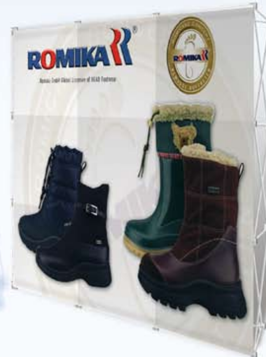
3 x 3 Felder gerade