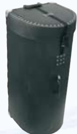
PVC-Transporttonne halbrund mit Rollen