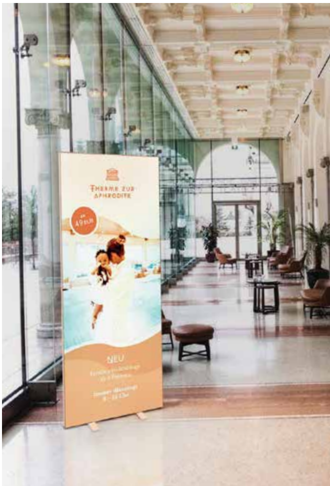
S.14 oben | p.14 top Pop Up Banner in einer Lobby | Pop Up banner in a lobby