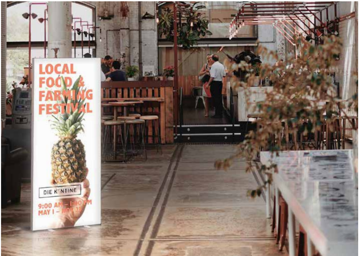
links | left Pop Up Aufsteller im Museum | Pop Up display in a museum