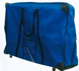
Transportnylontasche mit oder ohne Rollen