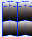
4 x 2 Felder mit Aufsatzblende