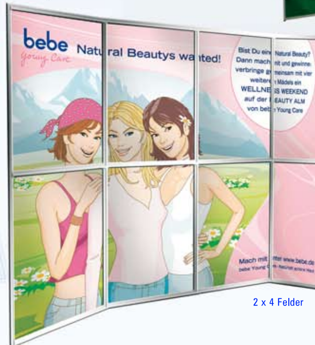
2 x 4 Felder