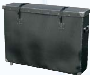
Kunststoffkoffer mit Rollen