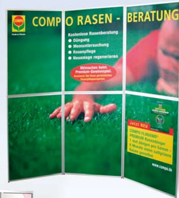
2 x 3 Felder