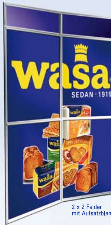
2 x 2 Felder mit Aufsatzblende